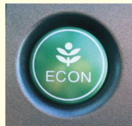
エコドライブスイッチの例

②エコドライブスイッチ * をONにしましょう。車の制御が変わって、ゆっくり加速しやすくなり、燃費が良くなります。